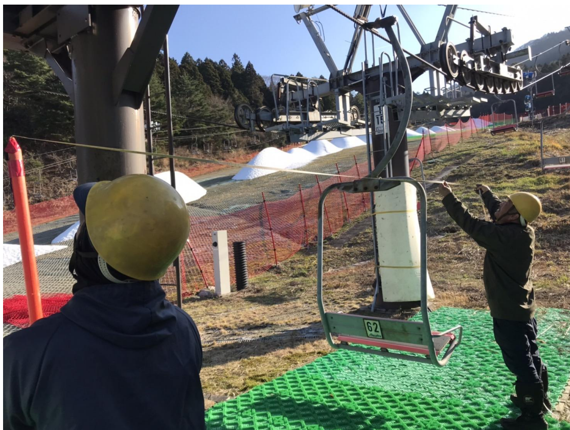
株式会社飯南トータルサポート 琴引フォレストパークスキー場

本報告書は、鉄道事業法に基づき、輸送の安全確保のための取組み状況や安全の実態について、自ら振り返るとともに広くご理解頂くために公表するものです。